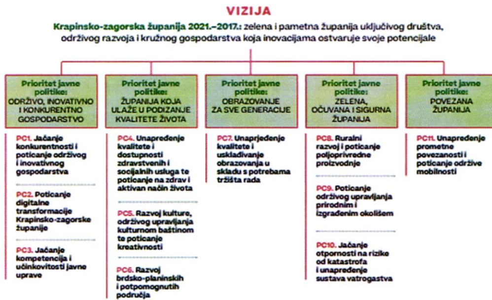
Slika 2 Shematski prikaz prioriteta i posebnih ciljeva Plana razvoja Krapinsko-zagorske županije za razdoblje 2021-2027. godine

Vizija: „Zelena i pametna županija uključivog društva, održivog razvoja i kružnog gospodarstva koja inovacijama ostvaruje svoje potencijale.”